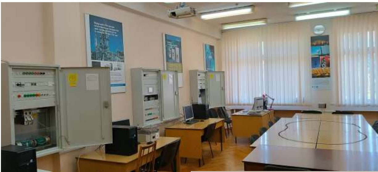
Лабораторії ABB та EATON