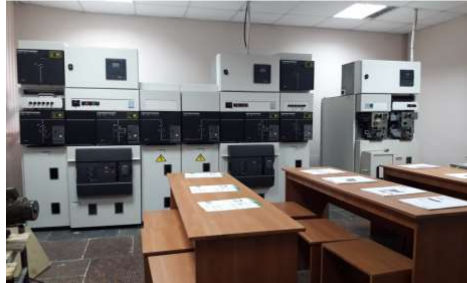
Лабораторія Schneider Electric